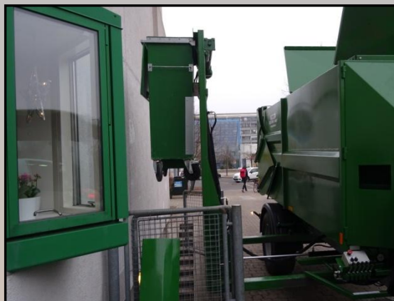
Forskydning af elevator 100cm