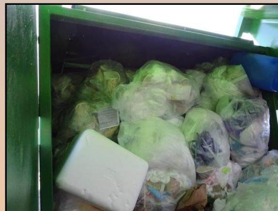
Aflæsning af affald