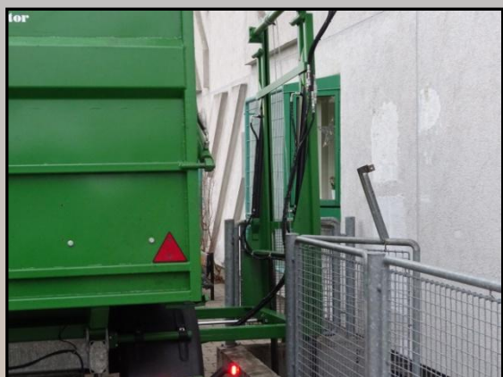
Forskydning af elevator 100 cm