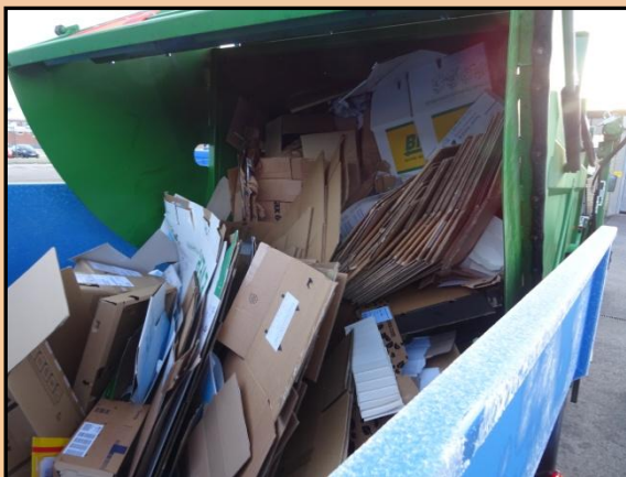
Entladen von pappe.