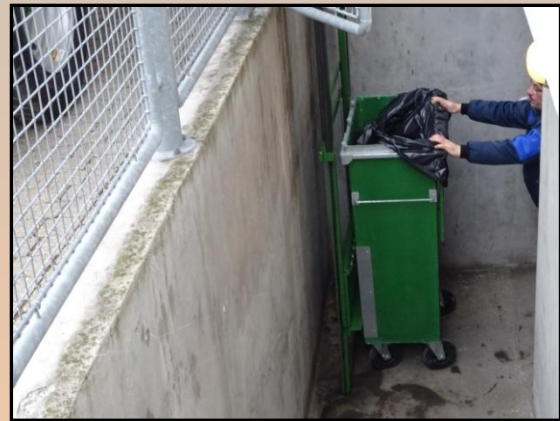
Elevator lange, aus Kellerschacht.