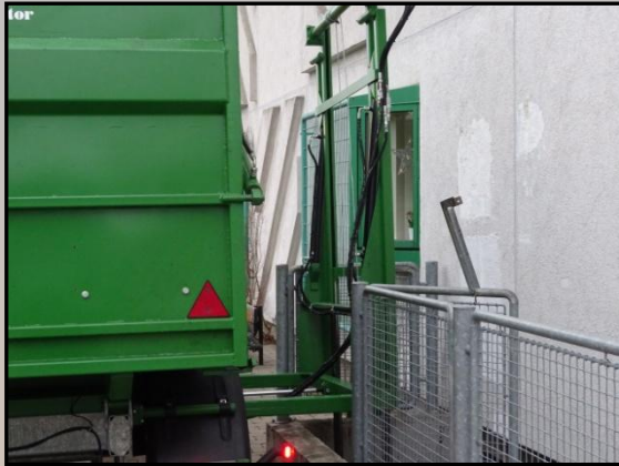
Verschiebung Elevator 100 cm.