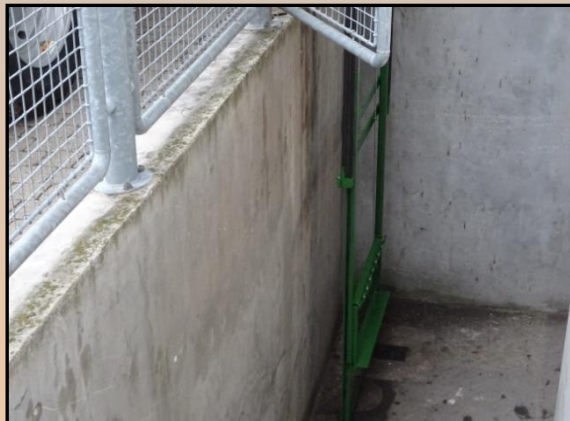
Elevator lange, aus Kellerschacht.