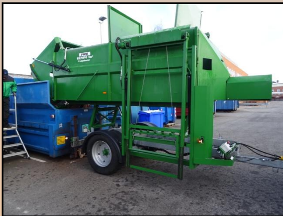
Entladen Höhe auf Wunsch.