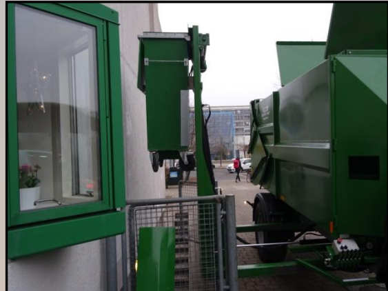
Verschiebung Elevator 100cm.